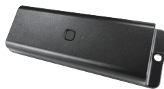
電源不要で長期利用可能な位置情報端末 docomapLongrange