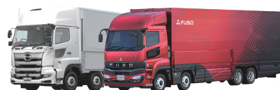
日野自動車・三菱ふそう連携 docomapVehicle