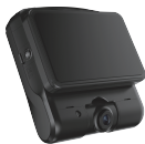
GPS内蔵ドライブレコーダー docomapEye