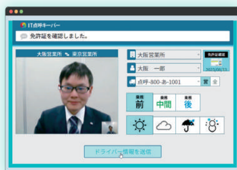
直感的に操作できるシンプルなボタン

案内に従って操作を行うだけで、アルコール測定を含む点呼が簡単に実施可能です。大きなボタンと分かりやすい画面設計のため、パソコン操作に不慣れな方でも安心してお使いいただけます。