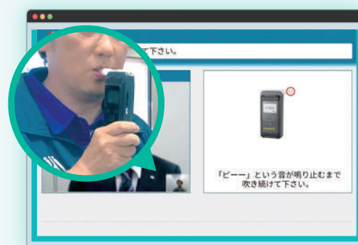
操作案内に従いアルコール測定